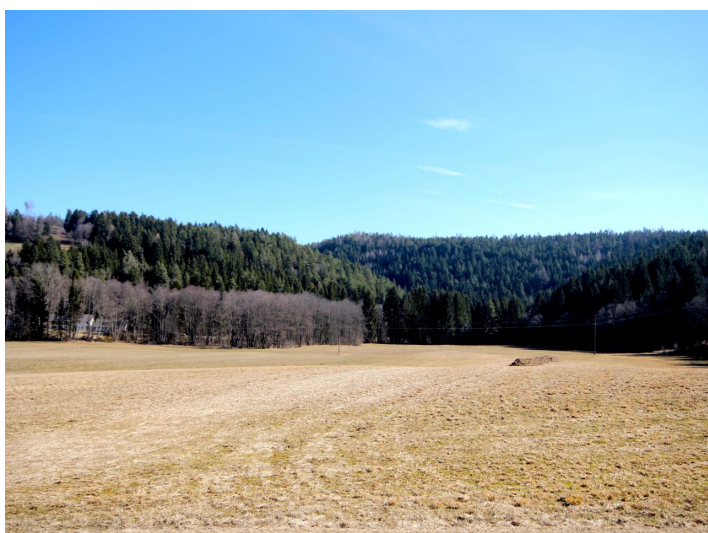
Günstiger Baugrund in Himmelberg/Feldkirchen