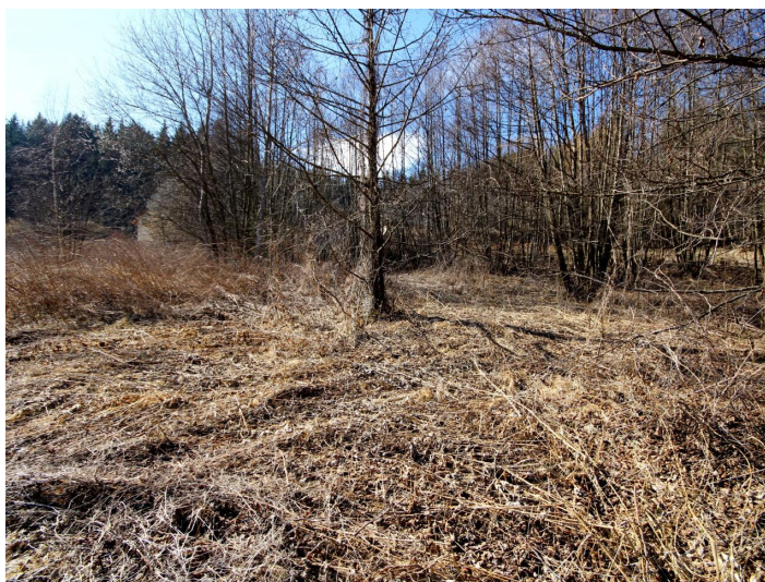
Günstiger Baugrund in Himmelberg/Feldkirchen