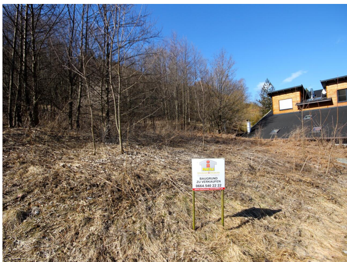
Günstiger Baugrund in Himmelberg/Feldkirchen