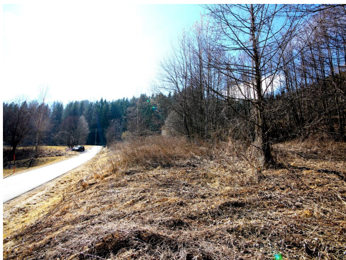
Baugrund in Himmelberg/Feldkirchen