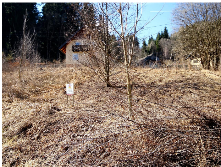
Baugrund in Himmelberg/Feldkirchen