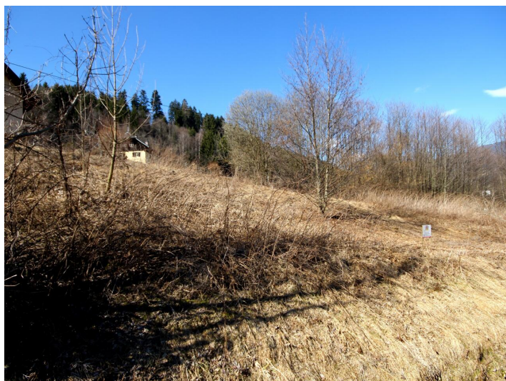
Baugrund in Himmelberg/Feldkirchen