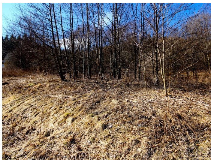
Baugrund in Himmelberg/Feldkirchen