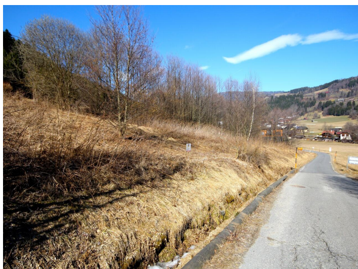
Baugrund in Himmelberg/Feldkirchen