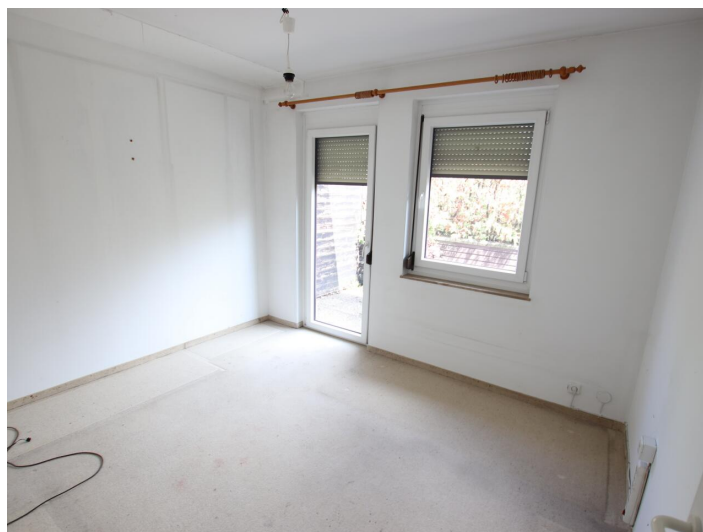
Penthouse 107m 2 mit 148m 2 XXL-Terrasse - Neptunweg