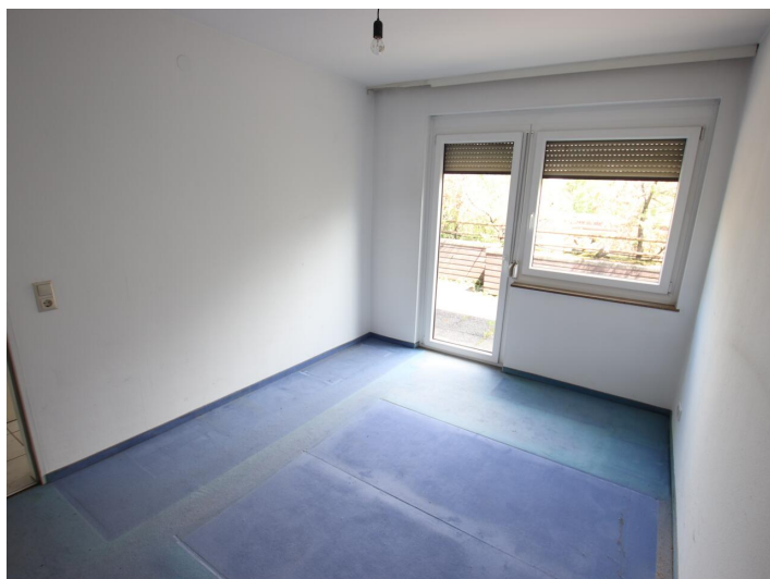
Penthouse 107m 2 mit 148m 2 XXL-Terrasse - Neptunweg