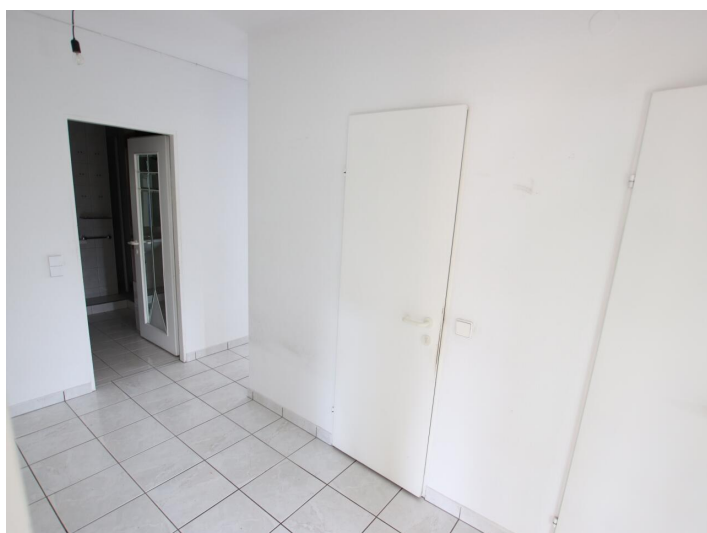
Penthouse 107m 2 mit 148m 2 XXL-Terrasse - Neptunweg