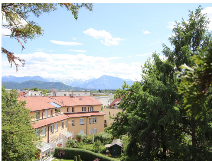
Penthouse 107m 2 mit 148m 2 XXL-Terrasse - Neptunweg