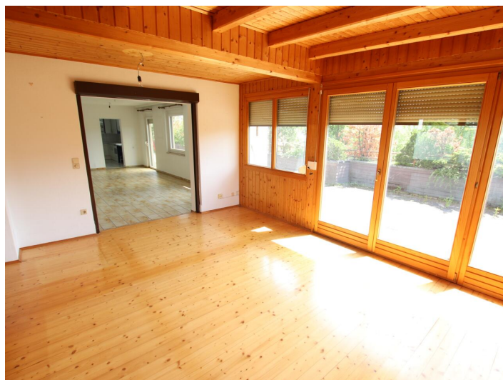
Penthouse 107m 2 mit 148m 2 XXL-Terrasse - Neptunweg