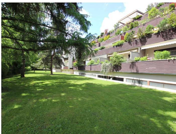
Penthouse 107m 2 mit 148m 2 XXL-Terrasse - Neptunweg