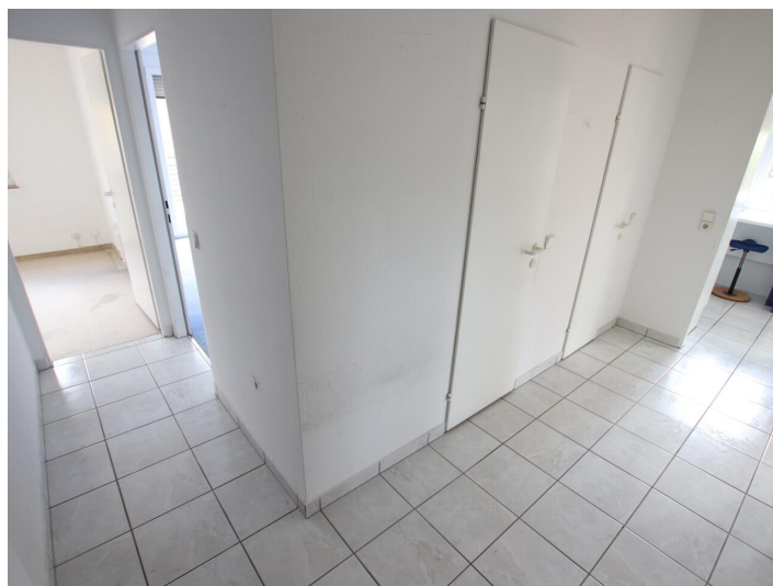
Penthouse 107m 2 mit 148m 2 XXL-Terrasse - Neptunweg