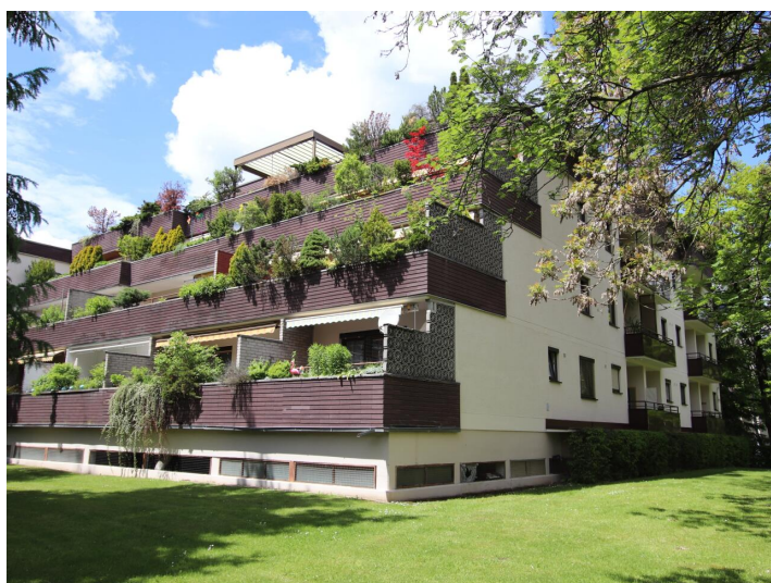
Penthouse 107m 2 mit 148m 2 XXL-Terrasse - Neptunweg