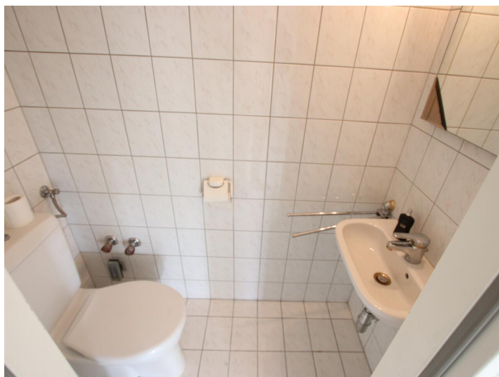
Penthouse 107m 2 mit 148m 2 XXL-Terrasse - Neptunweg