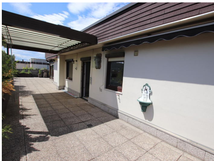
Penthouse 107m 2 mit 148m 2 XXL-Terrasse - Neptunweg