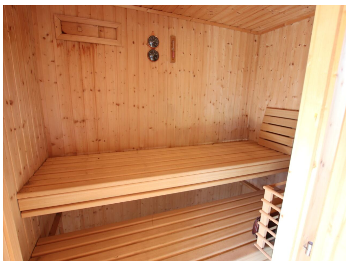
Penthouse 107m 2 mit 148m 2 XXL-Terrasse - Neptunweg