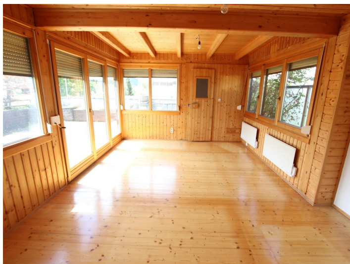
Penthouse 107m 2 mit 148m 2 XXL-Terrasse - Neptunweg