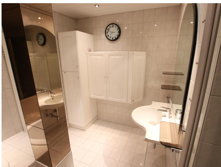
Penthouse 107m 2 mit 148m 2 XXL-Terrasse - Neptunweg