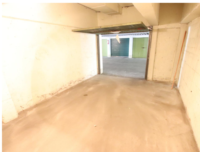
Penthouse 107m 2 mit 148m 2 XXL-Terrasse - Neptunweg