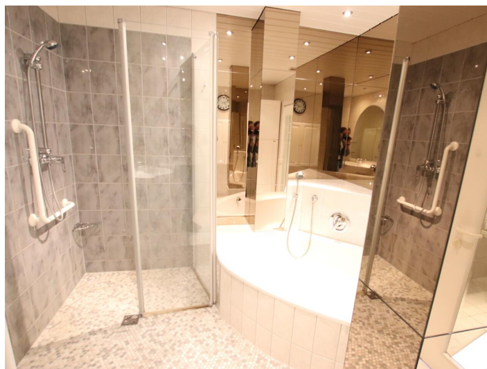
Penthouse 107m 2 mit 148m 2 XXL-Terrasse - Neptunweg