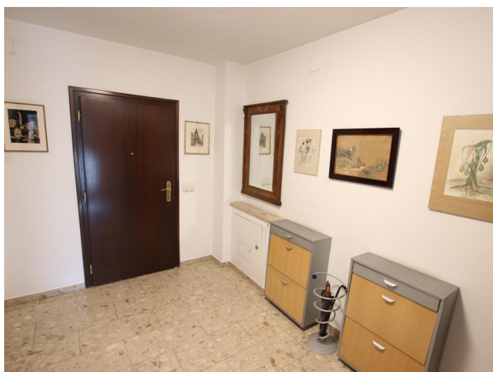
Penthouse 107m 2 mit 148m 2 XXL-Terrasse - Neptunweg