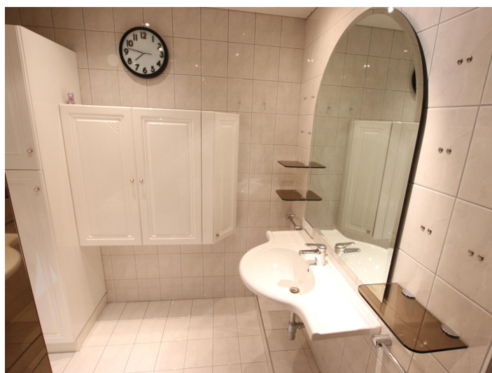
Penthouse 107m 2 mit 148m 2 XXL-Terrasse - Neptunweg