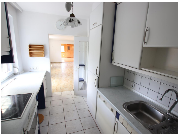
Penthouse 107m 2 mit 148m 2 XXL-Terrasse - Neptunweg