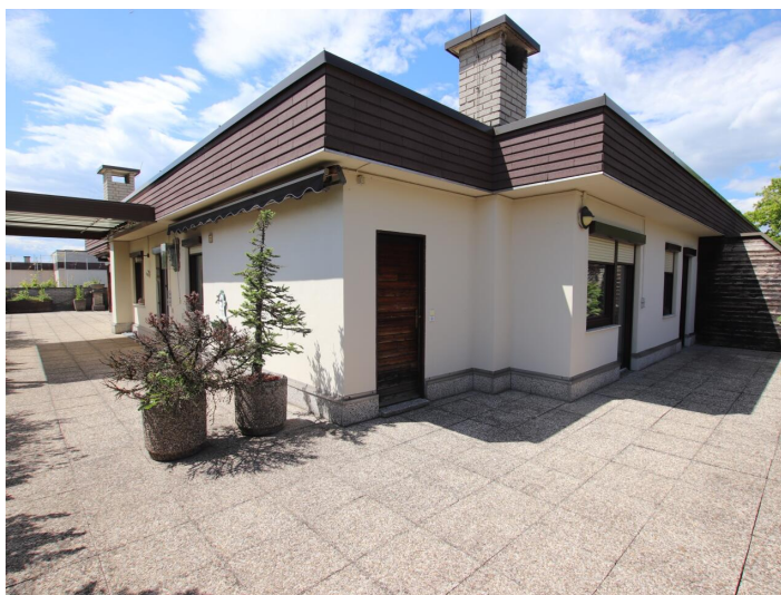
Penthouse 107m 2 mit 148m 2 XXL-Terrasse - Neptunweg