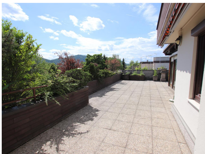
Penthouse 107m 2 mit 148m 2 XXL-Terrasse - Neptunweg