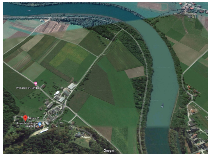
St. Egidien -Landwirtschaft, Grundstücke und Wälder