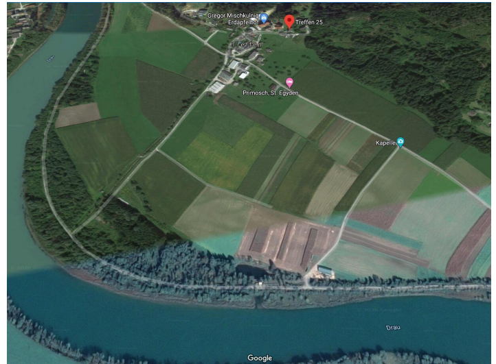
St. Egidien -Landwirtschaft, Grundstücke und Wälder