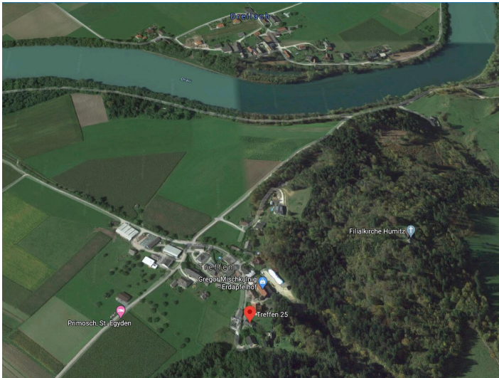
St. Egidien -Landwirtschaft, Grundstücke und Wälder