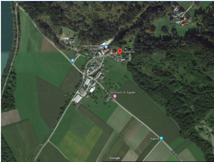
St. Egidien -Landwirtschaft, Grundstücke und Wälder