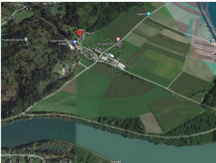
St. Egidien -Landwirtschaft, Grundstücke und Wälder