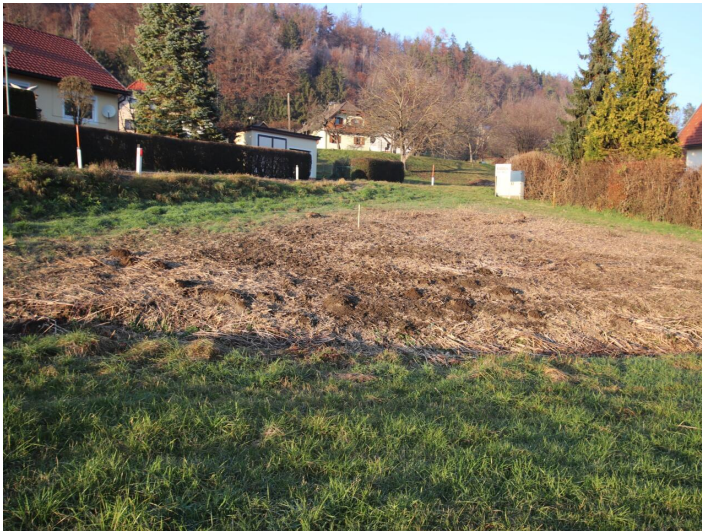
Günstiger 1.155m 2 Baugrund in Köttmannsdorf