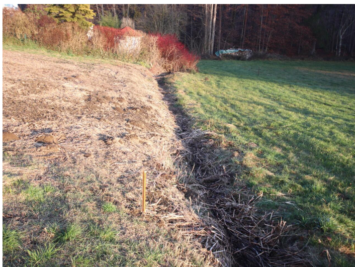
Günstiger 1.155m 2 Baugrund in Köttmannsdorf