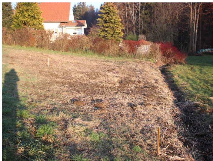
Günstiger 1.155m 2 Baugrund in Köttmannsdorf