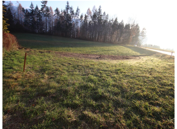
Günstiger 1.155m 2 Baugrund in Köttmannsdorf