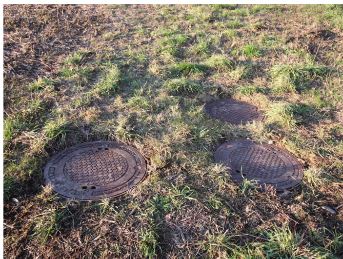
Günstiger 1.155m 2 Baugrund in Köttmannsdorf