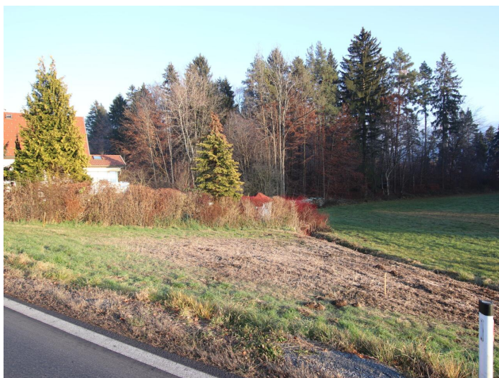
Günstiger 1.155m 2 Baugrund in Köttmannsdorf