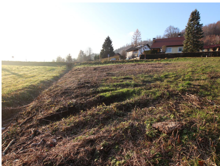
Günstiger 1.155m 2 Baugrund in Köttmannsdorf