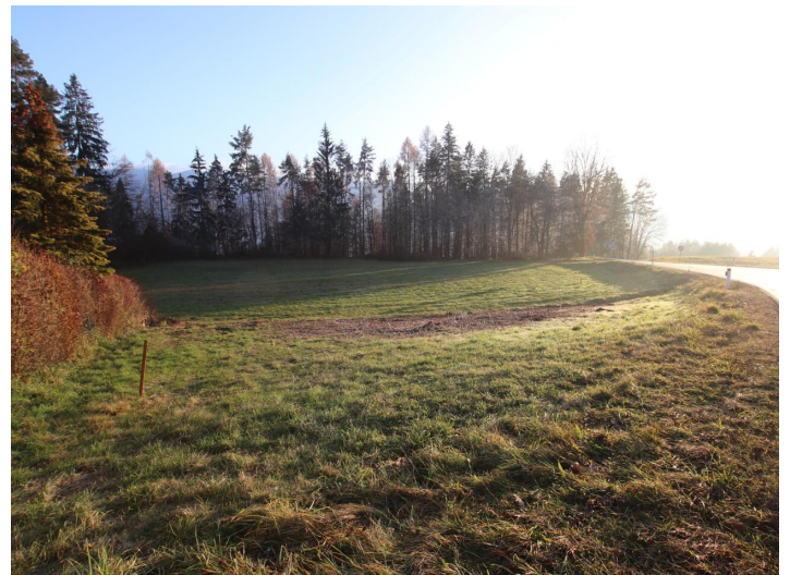
Günstiger 1.155m 2 Baugrund in Köttmannsdorf