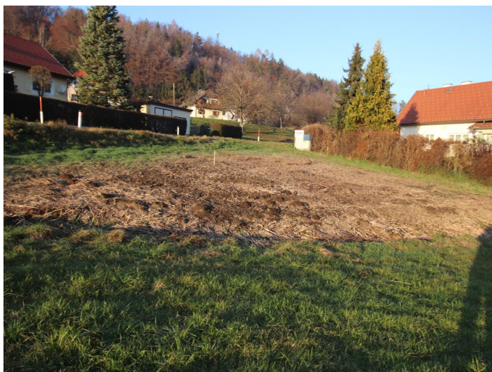
Günstiger 1.155m 2 Baugrund in Köttmannsdorf