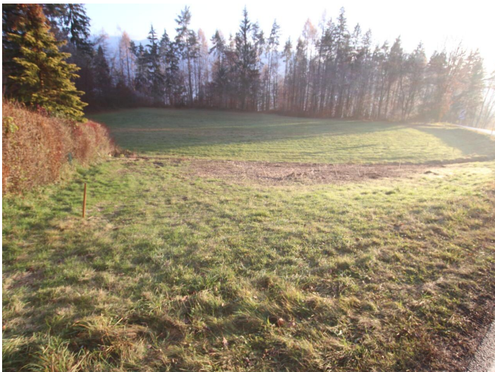
Günstiger 1.155m 2 Baugrund in Köttmannsdorf