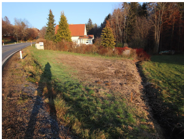
Günstiger 1.155m 2 Baugrund in Köttmannsdorf