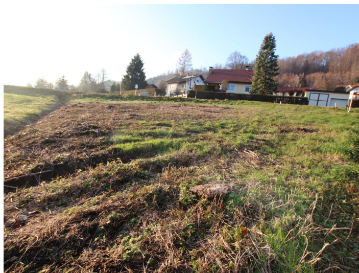
Günstiger 1.155m 2 Baugrund in Köttmannsdorf