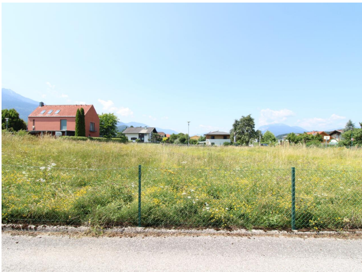
Sonniger Baugrund direkt bei der Apotheke Faak