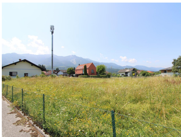
Sonniger Baugrund direkt bei der Apotheke Faak