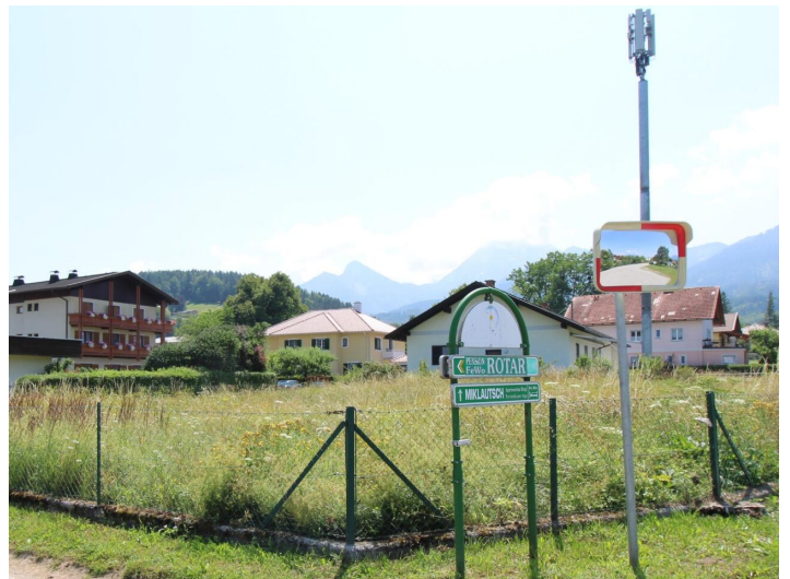
Sonniger Baugrund direkt bei der Apotheke Faak