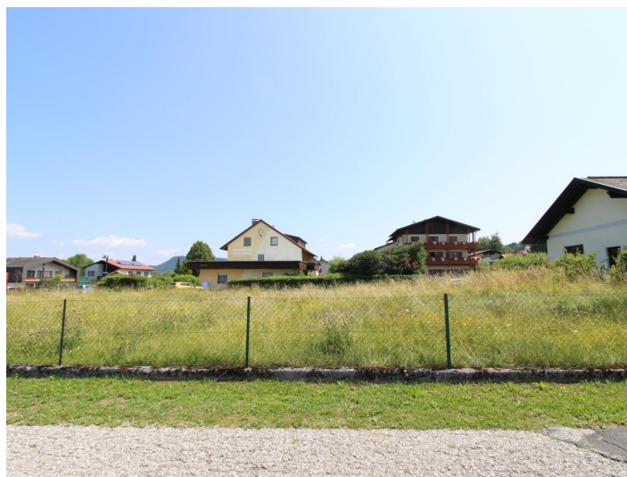
Sonniger Baugrund direkt bei der Apotheke Faak