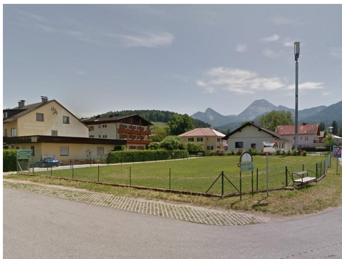
Sonniger Baugrund direkt bei der Apotheke Faak