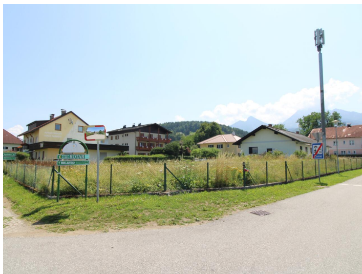
Sonniger Baugrund direkt bei der Apotheke Faak