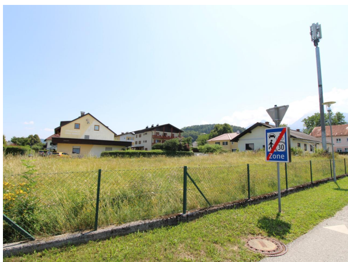
Sonniger Baugrund direkt bei der Apotheke Faak