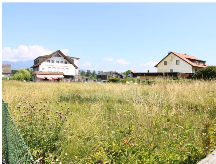
Sonniger Baugrund direkt bei der Apotheke Faak