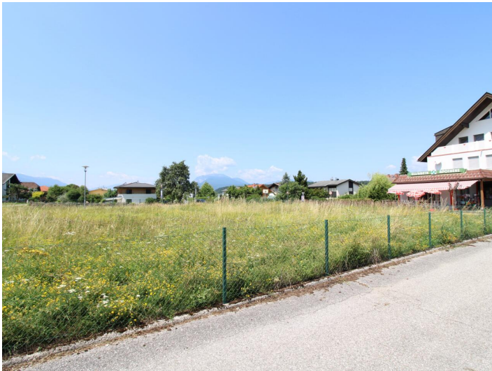
Sonniger Baugrund direkt bei der Apotheke Faak