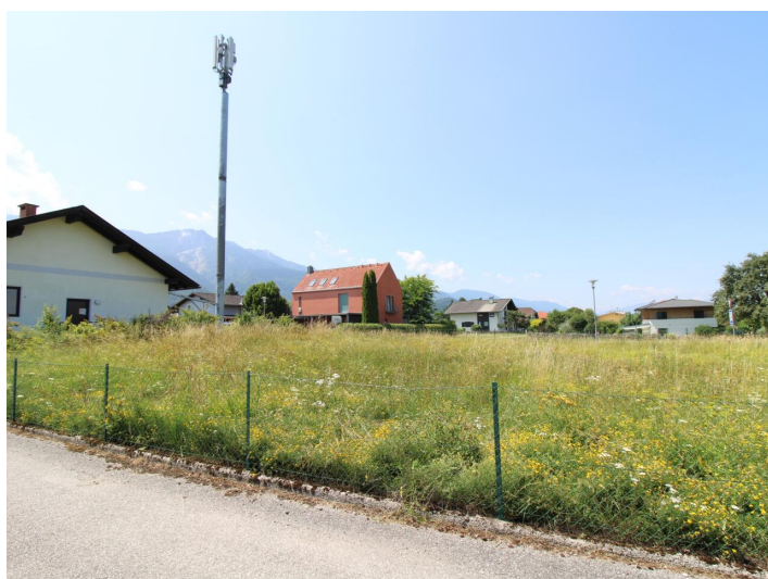
Sonniger Baugrund direkt bei der Apotheke Faak