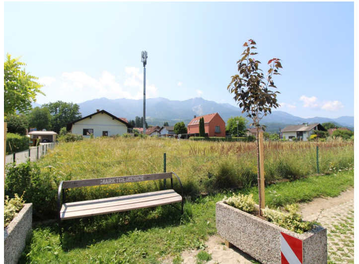
Sonniger Baugrund direkt bei der Apotheke Faak