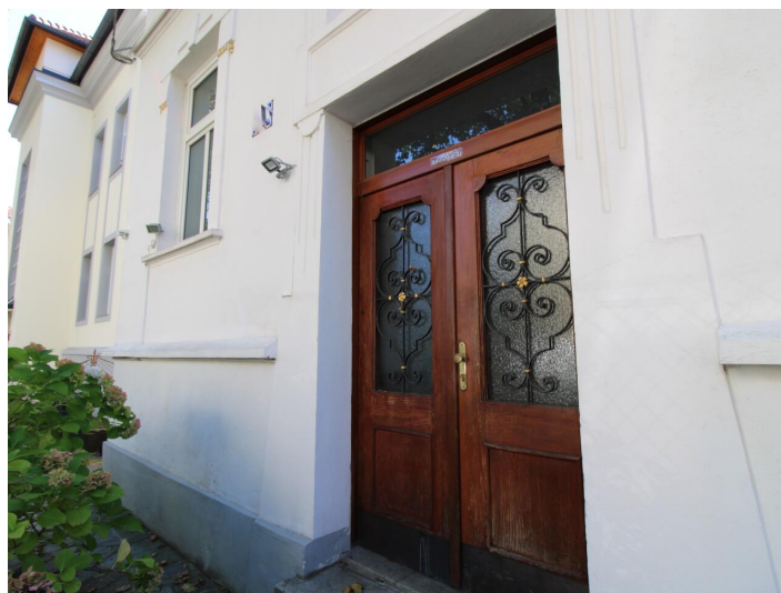
Einzigartige 3-Zimmerwohnung St. Martin Villa!