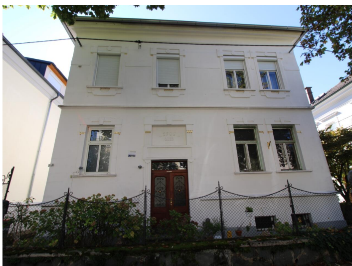
Einzigartige 3-Zimmerwohnung St. Martin Villa!