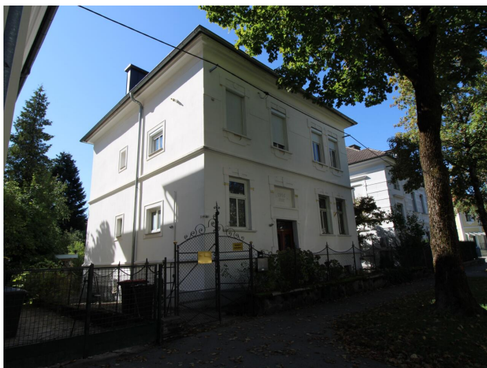
Einzigartige 3-Zimmerwohnung St. Martin Villa!