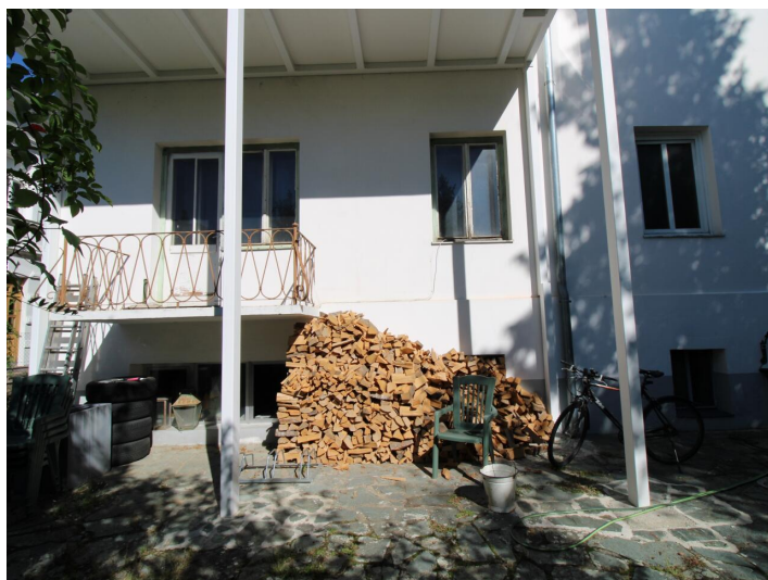
Einzigartige 3-Zimmerwohnung St. Martin Villa!