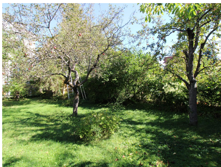
Einzigartige 3-Zimmerwohnung St. Martin Villa!