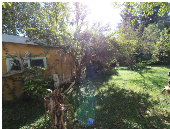
Einzigartige 3-Zimmerwohnung St. Martin Villa!