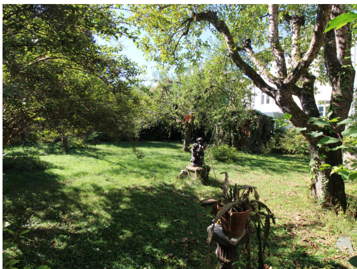
Einzigartige 3-Zimmerwohnung St. Martin Villa!