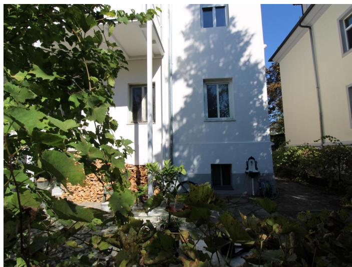
Einzigartige 3-Zimmerwohnung St. Martin Villa!