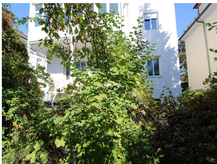
Einzigartige 3-Zimmerwohnung St. Martin Villa!