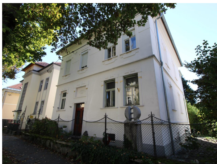
Einzigartige 3-Zimmerwohnung St. Martin Villa!