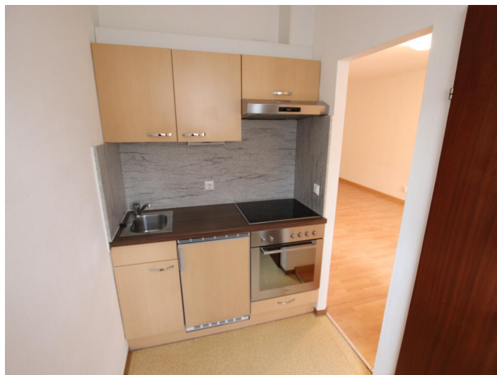
Garconniere mit Loggia & Garage am Neptunweg in Uni- und Wörthersee Lage