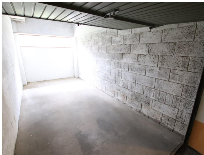
Garconniere mit Loggia & Garage am Neptunweg in Uni- und Wörthersee Lage