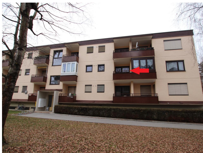
Garconniere mit Loggia & Garage am Neptunweg in Uni- und Wörthersee Lage