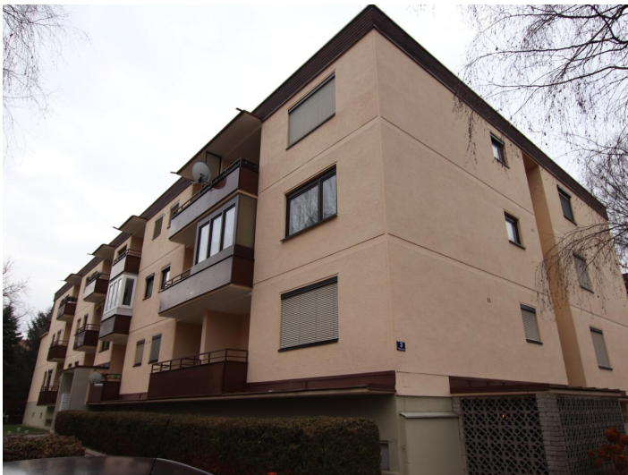
Garconniere mit Loggia & Garage am Neptunweg in Uni- und Wörthersee Lage