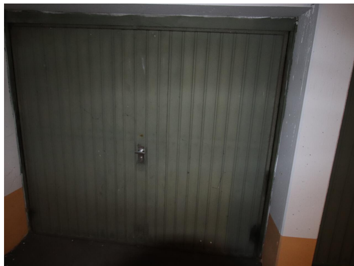
Garconniere mit Loggia & Garage am Neptunweg in Uni- und Wörthersee Lage