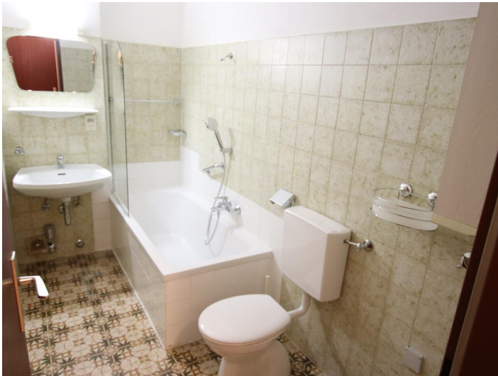
Garconniere mit Loggia & Garage am Neptunweg in Uni- und Wörthersee Lage