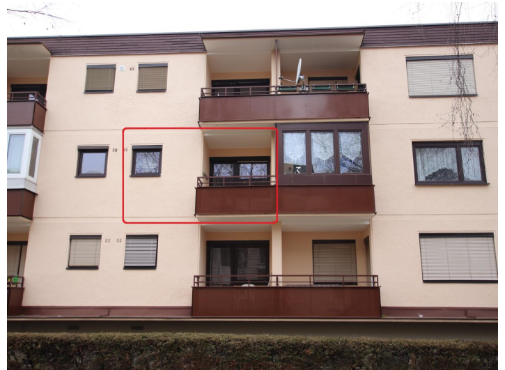
Garconniere mit Loggia & Garage am Neptunweg in Uni- und Wörthersee Lage