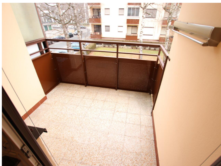
Garconniere mit Loggia & Garage am Neptunweg in Uni- und Wörthersee Lage