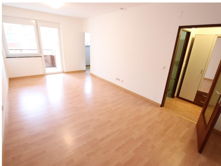
Garconniere mit Loggia & Garage am Neptunweg in Uni- und Wörthersee Lage