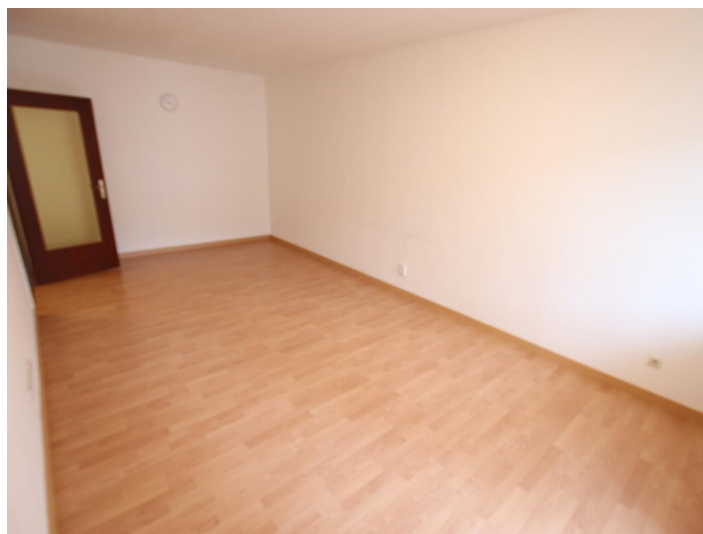
Garconniere mit Loggia & Garage am Neptunweg in Uni- und Wörthersee Lage