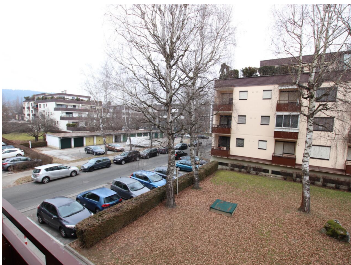
Garconniere mit Loggia & Garage am Neptunweg in Uni- und Wörthersee Lage