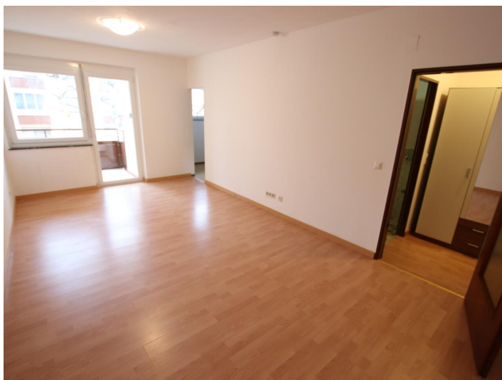
Garconniere mit Loggia & Garage am Neptunweg in Uni- und Wörthersee Lage