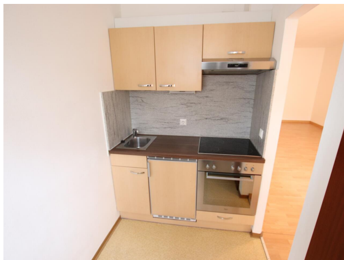
Garconniere mit Loggia & Garage am Neptunweg in Uni- und Wörthersee Lage