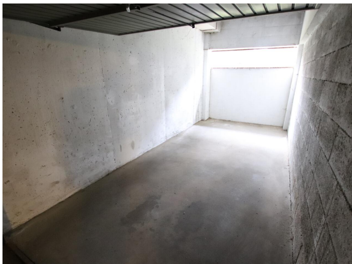
Garconniere mit Loggia & Garage am Neptunweg in Uni- und Wörthersee Lage