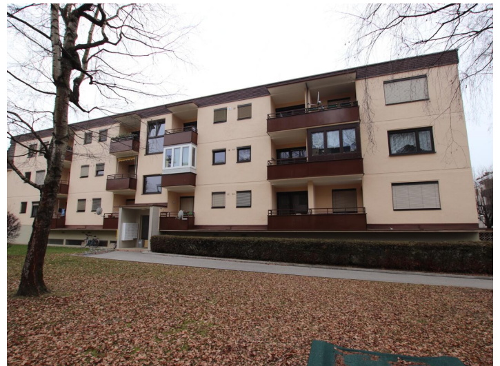
Garconniere mit Loggia & Garage am Neptunweg in Uni- und Wörthersee Lage