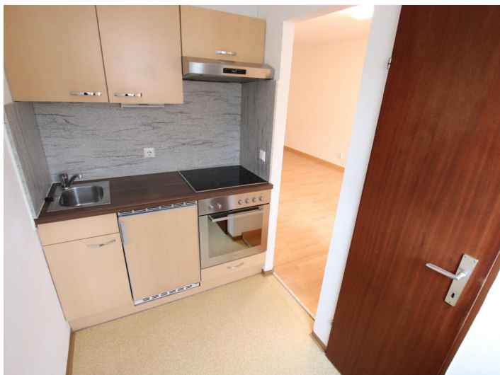
Garconniere mit Loggia & Garage am Neptunweg in Uni- und Wörthersee Lage