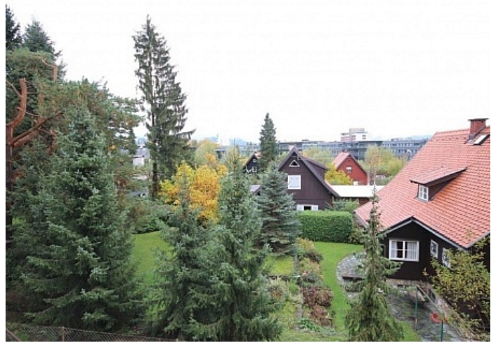
2 - Zi Wohnung Nähe Klinikum Klagenfurt