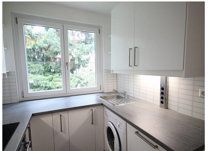
2 - Zi Wohnung Nähe Klinikum Klagenfurt