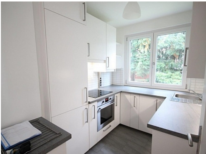
2 - Zi Wohnung Nähe Klinikum Klagenfurt