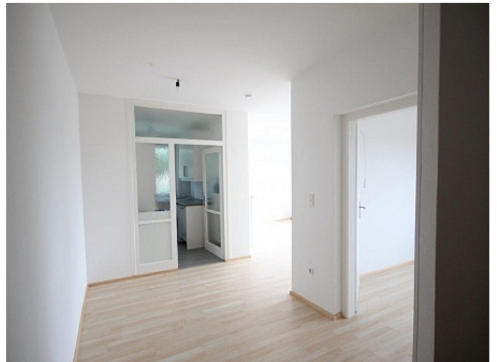
2 - Zi Wohnung Nähe Klinikum Klagenfurt