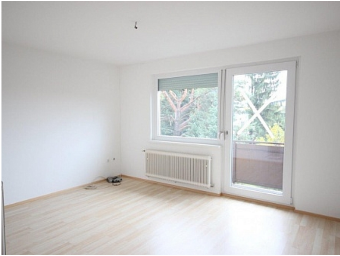
2 - Zi Wohnung Nähe Klinikum Klagenfurt