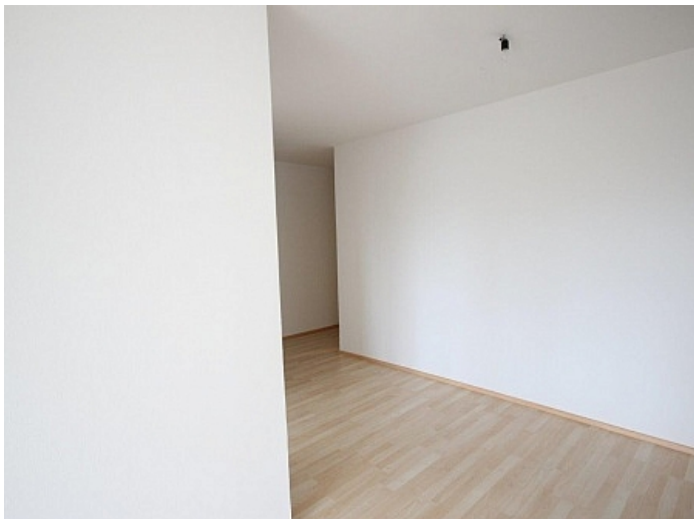
2 - Zi Wohnung Nähe Klinikum Klagenfurt