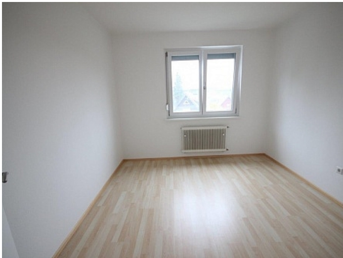
2 - Zi Wohnung Nähe Klinikum Klagenfurt