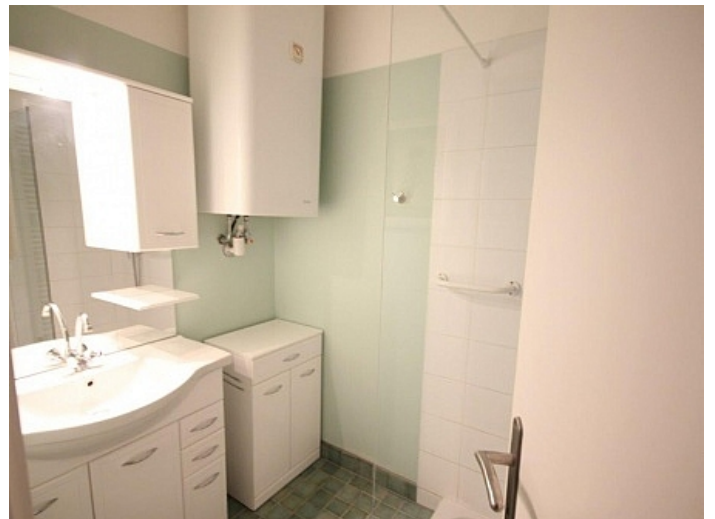
2 - Zi Wohnung Nähe Klinikum Klagenfurt