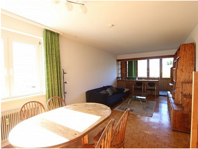
Schöne 4 Zi Wohnung in Waidmannsdorf WG- tauglich