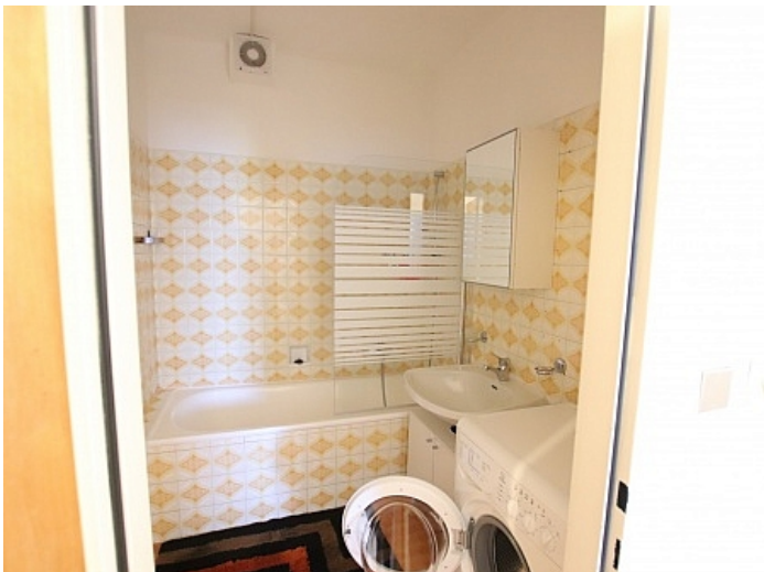
Schöne 4 Zi Wohnung in Waidmannsdorf WG- tauglich