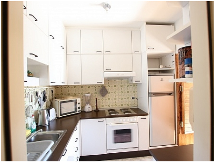
Schöne 4 Zi Wohnung in Waidmannsdorf WG- tauglich