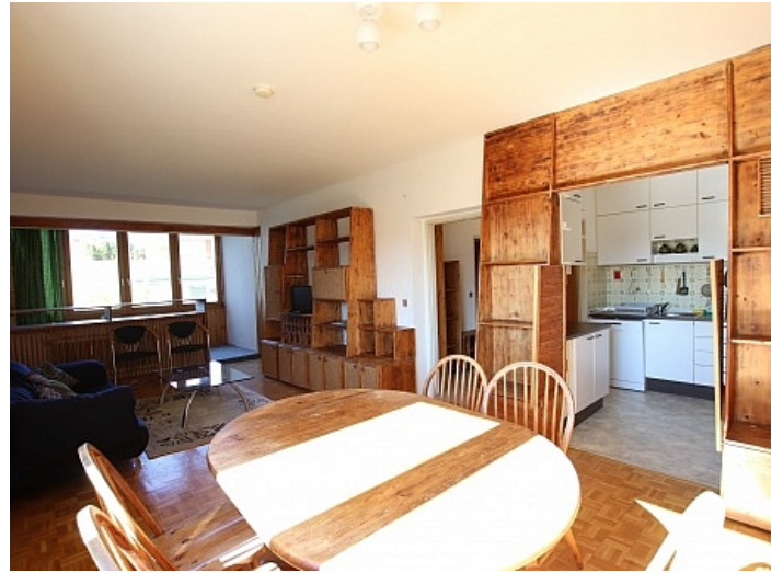
Schöne 4 Zi Wohnung in Waidmannsdorf WG- tauglich