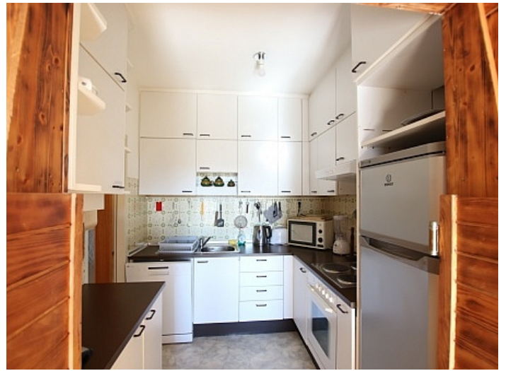
Schöne 4 Zi Wohnung in Waidmannsdorf WG- tauglich