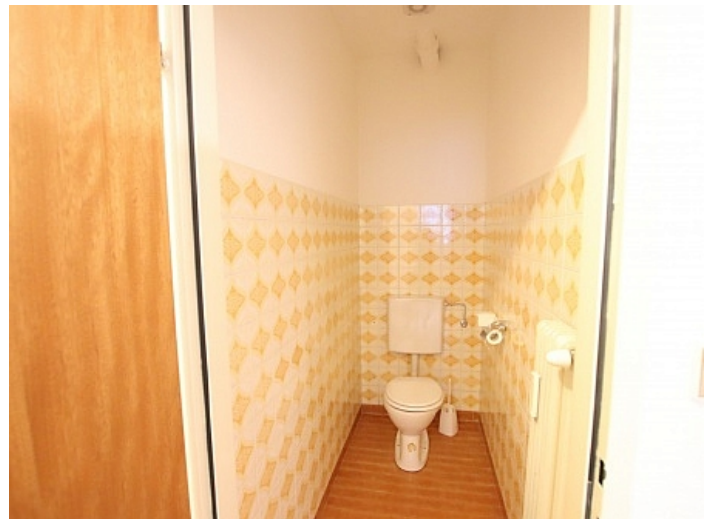
Schöne 4 Zi Wohnung in Waidmannsdorf WG- tauglich