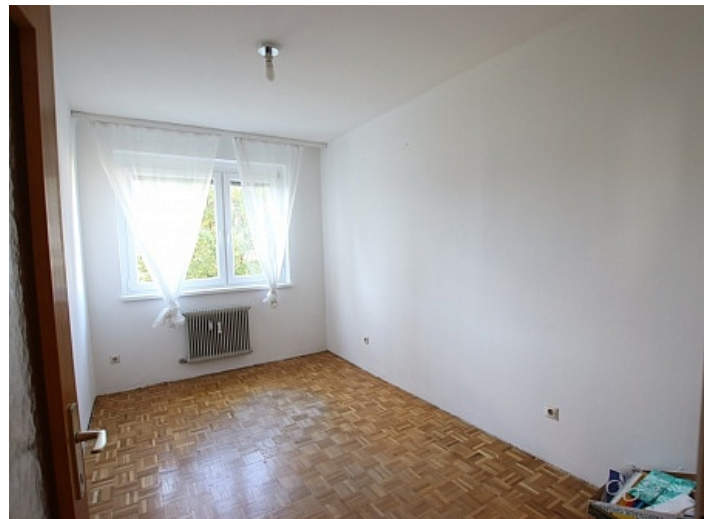
Schöne 4 Zi Wohnung in Waidmannsdorf WG- tauglich