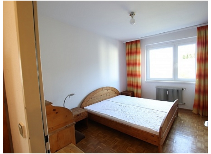
Schöne 4 Zi Wohnung in Waidmannsdorf WG- tauglich