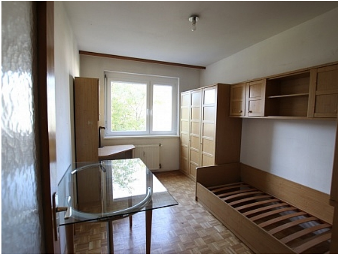
Schöne 4 Zi Wohnung in Waidmannsdorf WG- tauglich