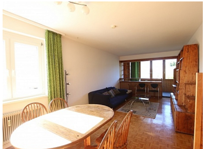
Schöne 4 Zi Wohnung in Waidmannsdorf WG- tauglich