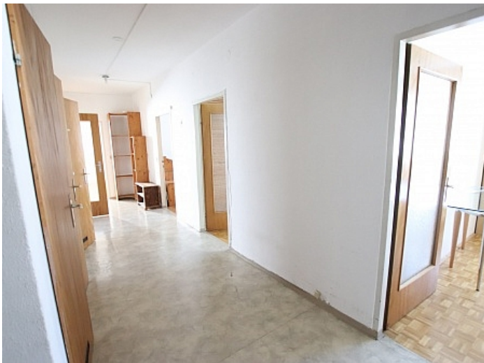
Schöne 4 Zi Wohnung in Waidmannsdorf WG- tauglich