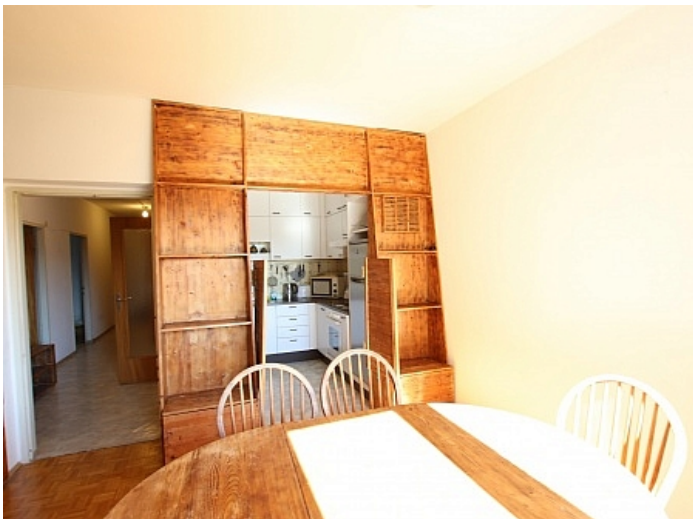
Schöne 4 Zi Wohnung in Waidmannsdorf WG- tauglich