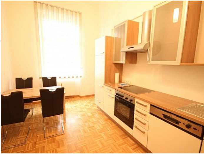
KOPIE_Schöne, kleine Altbauwohnung im Zentrum