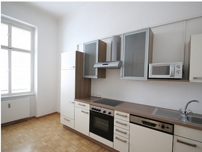
KOPIE_Schöne, kleine Altbauwohnung im Zentrum