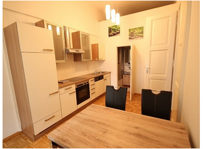
KOPIE_Schöne, kleine Altbauwohnung im Zentrum