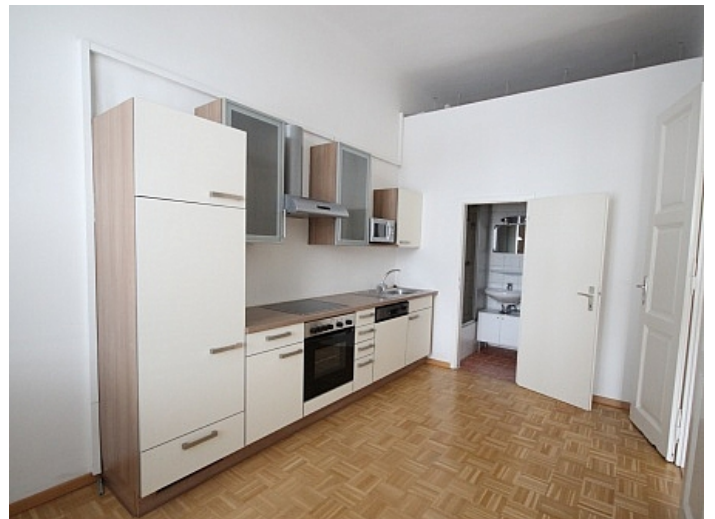
KOPIE_Schöne, kleine Altbauwohnung im Zentrum