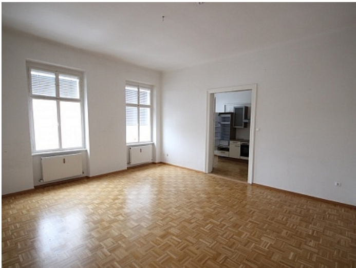
KOPIE_Schöne, kleine Altbauwohnung im Zentrum