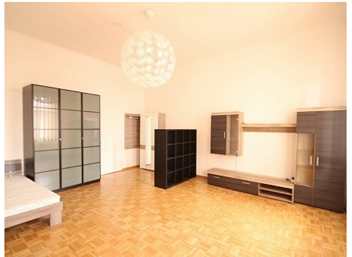
KOPIE_Schöne, kleine Altbauwohnung im Zentrum