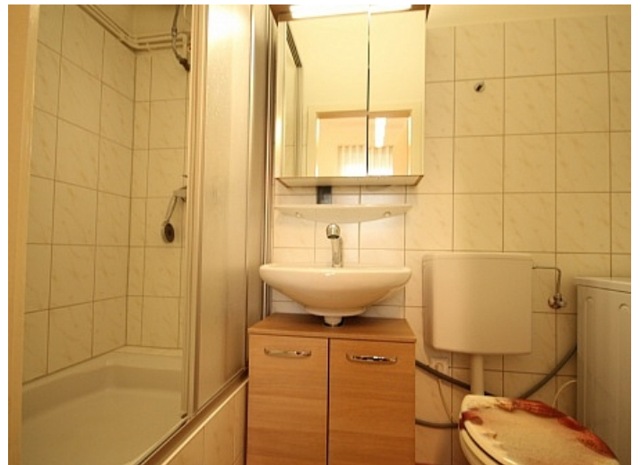
KOPIE_Schöne, kleine Altbauwohnung im Zentrum