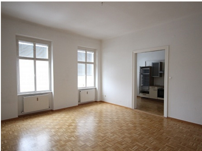
KOPIE_Schöne, kleine Altbauwohnung im Zentrum